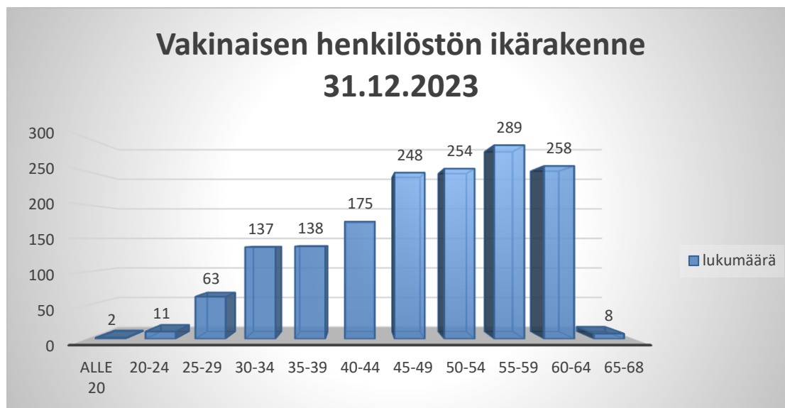
Kuva 1. Vakinaisen henkilöstön ikärakenne

Henkilöstön ikärakenne raportoidaan Kuntatyönantajan suosituksen mukaisesti viiden vuoden välein ja keski-ikä raportoidaan yhden desimaalin tarkkuudella. Toimivassa työyhteisössä on hyvä olla eri-ikäistä henkilöstöä. Mikkelin kaupungin henkilöstörakenne on esitetty kuvassa kaksi. Keski-ikä vuonna 2023 oli 48,8 mikä on vähän korkeampi kuin vuosi sitten (48,06 vuonna 2022). 51 prosenttia (vuonna 2022 50 %) henkilöstöstä on 50 vuotta täyttäneitä, minkä takia henkilöstöjohtamisessa tulee jatkossakin ottaa huomioon ikääntyvien johtaminen osana työhyvinvoinnin johtamista.